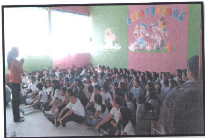
San José Pínula, Guatemala. Primaria Vespertina. EOUM Lotificación Santa Sofía