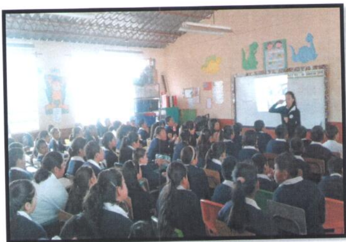
Santa Catarina Pínula, Guatemala. Primaria Matutina. EORM No. 811