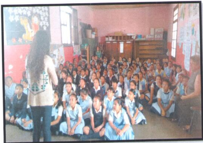
Guatemala, Guatemala. Primaria Matutina. EOUM No. 67 Aplicación Belén.